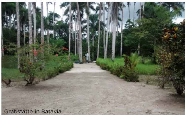
Grabstätte in Batavia

Viele Verstorbene begleitete er zum Friedhof, wo auch er selbst schließlich begraben wurde.