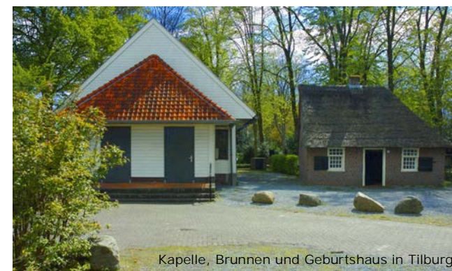
Kapelle, Brunnen und Geburtshaus in Tilburg

Unterdessen nimmt der Bekanntheitsgrad von Petrus Donders immer noch zu, nicht nur, weil die Redemptoristen in aller Welt „ihren“ Seligen schätzen, sondern auch dank der Arbeit der weltlichen Peerke Donders Stichting für Leprabekämpfung in Südostasien. Daneben wird die Verehrung von Petrus Donders gefördert von der Tilburger Kommission Verehrung Petrus Donders, dem Vizepostulator in den Niederlanden, dem Vizepostulator in Surinam, der dortigen Stichting Devotie Petrus Donders und der Stichting Petrus Donders Tilburg.